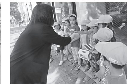
▲広小路西側交差点付近で、募金活動をする藤花保育園の園児たち