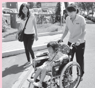
▲社協フェスタ2019の「車いす体験」