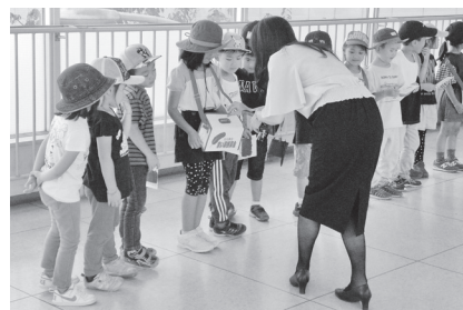
▲イオン帯広店連絡通路で、募金活動をするさくら保育園の園児たち

各種福祉施設やボランティア団体をはじめ、民間の福祉活動を財政面から広く支援するために募金運動を展開しています。一人ひとりの思いやりがこれらの福祉活動を支えています。