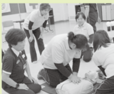
▲令和元年度の救急救命法研修