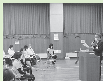
▲全員参加で感染症対策を学んでいます。