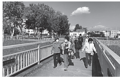
ウォーキングで、体力の低下と閉じこもりを予防。人と会える大切さを改めて実感しました。

ロン活動も休止を余儀なくされ、現在も再開したサロンは約半数となっています。しかし、そのような中でも、「コロナ禍で離れているからこそ、思いを届けたい。」とさまざまな取り組みが生まれています。手作りのマスクとマスクケースを届けたり、絵手紙に心温まるメッセージを入れて郵送したり、心と体がリフレッシュできる集団ウォーキングや、地域の老人クラブと力を合わせてラジ操を企画するなど、「コロナ禍でも大切なものを失わないように!」と地域ではさまざまな工夫と想いが溢れる取り組みが行われています。「コロナ禍だからこそつながりを大切にしたい。」という皆さまの気持ちを社協は応援しています。