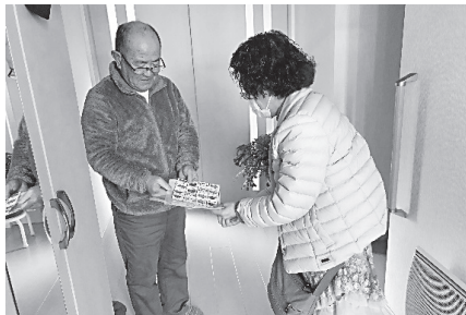
サロン活動休止中に、訪問して手作りのマスクと脳トレプリントをプレゼント

市内の地域交流サロン(現在28か所)は、感染防止のため令和2年2月から令和3年3月末までの一年以上の長い間、活動の「一斉自粛」を行いました。また、緊急事態宣言下では、会場の公共施設が休館し、サ