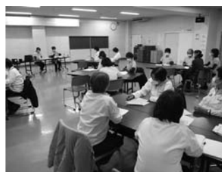
▲「看取り」をテーマに職員研修を行いました。