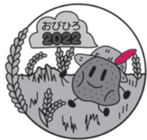
『麦畑を走ってるじゃがいもくん』 制作者: 蔵光 永さん

帯広大谷高等学校の生徒さんに制作いただいた17点のデザインの中から、共同募金推進委員会での選考により、こちらの2点が選ばれました!