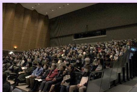
▲当日の会場のような十勝管内からボランティア実践者の方が多く集まりました。

池田町長は頑張っている仲間たちが池田に生まれ育ち生活することに誇りが感じられるような事業展開していけたらと・・・とお話しされていました。池田町民が連帯して町を変えようとする生き方に共感し、ボランティア皆が一丸となり、盛り上がったミニ愛ランドでした。（参加人数 368人）