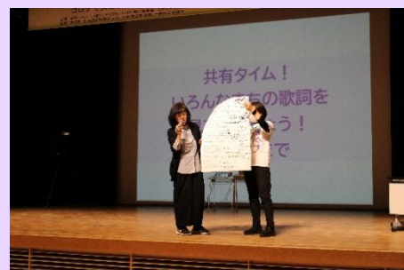
▲第1分科会でのようす 帯広市が代表して発表しました。帯広の自慢できるスポットを盛り込んだ歌詞をお披露目しました。